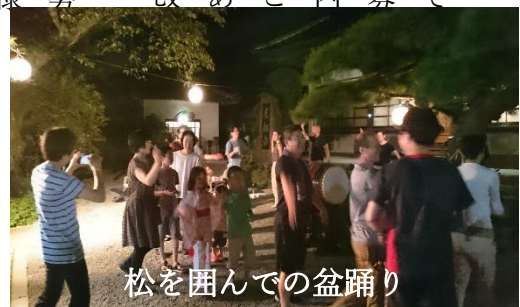
松を囲んでの盆踊り